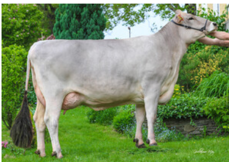
GS DACAPO - M ALICE